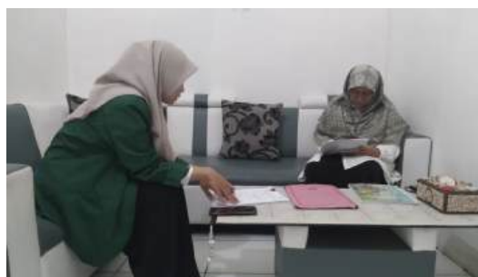
Gambar 1. Wawancara pada 3 November 2025

“untuk verifikasi pertama via cash akan dilakukan penghitungan dana melalui Cash Opname harian, setelah itu akan dikumpulkan menjadi Cash Opname bulanan. Begitu juga transfer dengan menggunakan rekening koran harian dan nanti akan ditutup menjadi buku rekening koran bulanan, yang membuat semua dana masuk dan keluar sama. Dapat dilihat di verifikasi dan validasi menggunakan LPJ dari penggunaannya berupa nota-nota belanja maupun nota dari distribusi pendayagunaan yang lain” .