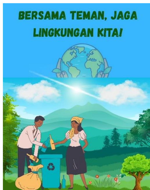
Gambar 4. Contoh Poster Desain Grafis Siswa

Pada sesi desain grafis, siswa menggunakan aplikasi Canva sebagai media produksi konten. Peserta dilatih untuk membuat tata letak visual, mengatur tipografi, memilih kombinasi warna yang harmonis, dan memasukkan elemen grafis pendukung. Sebagian besar peserta dapat mengoperasikan fitur dasar maupun lanjutan, terutama dalam membuat poster yang memadukan teks dan elemen visual secara proporsional. Karya yang dihasilkan menunjukkan pemahaman awal mengenai prinsip desain sederhana, seperti keseimbangan visual, hirarki informasi, dan kontras warna. Keterampilan ini menjadi fondasi penting bagi siswa untuk memproduksi konten digital edukatif di masa mendatang.