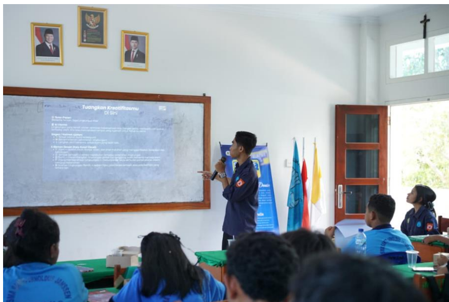
Gambar 1. Pemaparan Materi Creative Skills

Hasil latihan penulisan berita menunjukkan bahwa peserta sudah mampu mengintegrasikan unsur 5W+1H dengan cukup baik. Mereka dapat menyusun paragraf pembuka (lead) yang ringkas dan langsung menggambarkan inti peristiwa, kemudian mengembangkan informasi tambahan pada bagian body hingga menutup tulisan dengan detail kontekstual. Beberapa peserta memberikan pendekatan kreatif pada pilihan judul, namun tetap sesuai dengan prinsip provokatif yang etis dalam jurnalisme. Secara umum, kualitas tulisan menggambarkan peningkatan kemampuan memahami struktur dan logika penulisan berita.