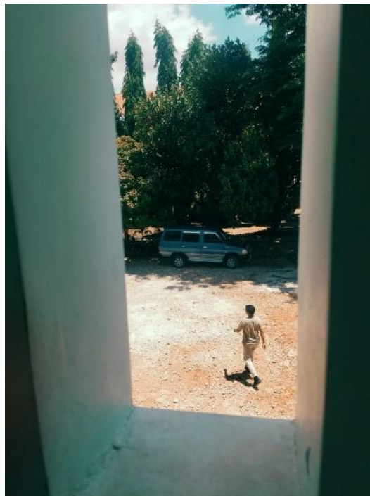
Gambar 3. Contoh Hasil Foto Siswa

latar yang lebih bersih. Beberapa kelompok bahkan mampu menjelaskan alasan komposisi visual yang mereka pilih, menandakan pemahaman konseptual yang mulai terinternalisasi.