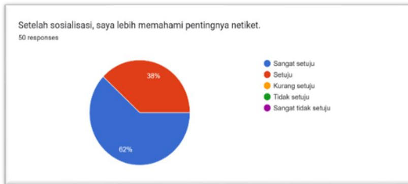
Gambar 4. Aspek Pengetahuan