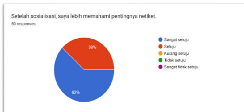
Gambar 6. Aspek Pemahaman

Sementara itu, gambar 4-6 menunjukkan adanya peningkatan skor pada aspek pengetahuan, motivasi dan pemahaman setelah kegiatan