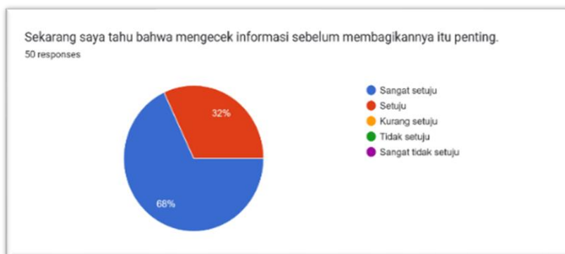
Gambar 5. Aspek Motivasi